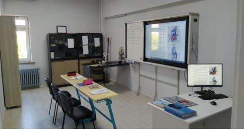
1 adet Fen Laboratuvarı