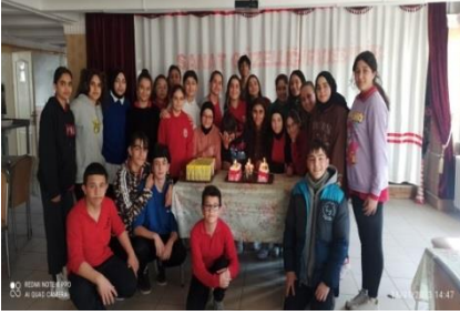
Doğum Günü Etkinliği