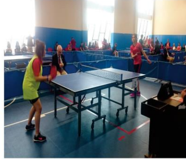
Türkiye 3. 'sü