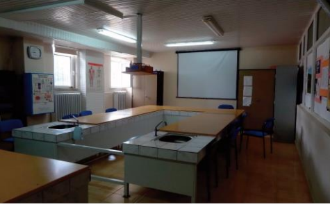
1 adet Fen Laboratuvarı