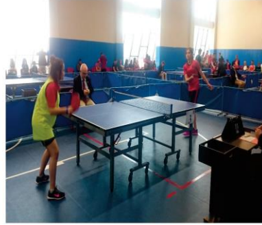
Türkiye 3. 'sü