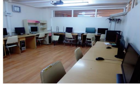
2 adet BT sınıfı