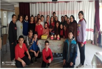
Doğum Günü Etkinliği