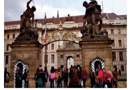
AB Erasmus Projesi