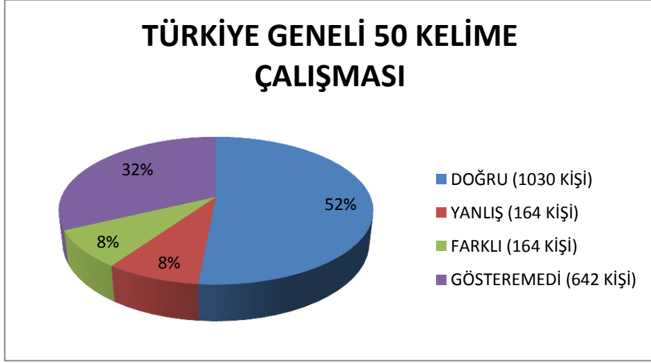
Şekil 2: Türkiye Geneli 50 Kelime Çalışması Pasta Grafiği

20 Okul, 20 Öğretmen ve 40 Öğrenci ile yapılan çalışmada toplam tekrar ile öğrencilere 2000 kelime yönlendirilmiş, elde edilen sonuçlar şekil 2’deki pasta grafiğinde gösterilmiştir. Bu grafik incelendiğinde;